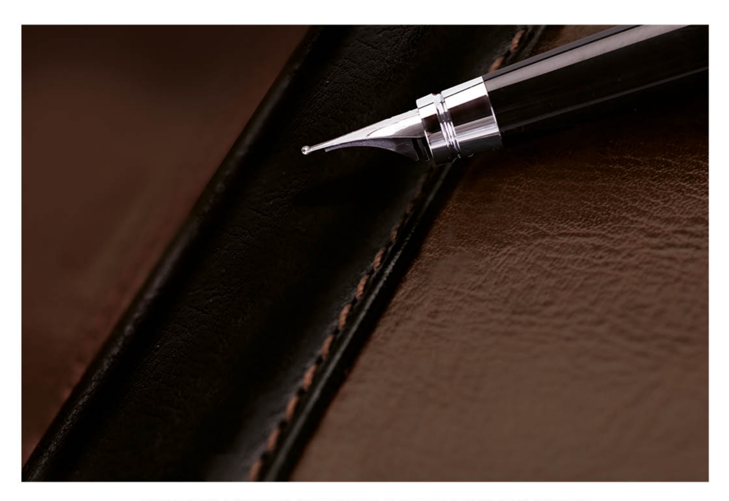
L'EXCELLENCE ENTRE LAC ET MONTAGNES