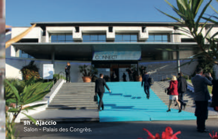
9h - Ajaccio Salon - Palais des Congrès.