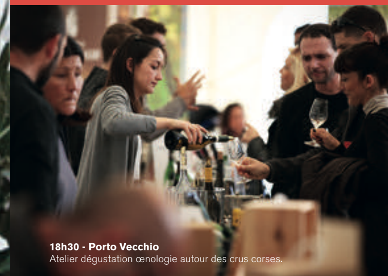
18h30 - Porto Vecchio Atelier dégustation œnologie autour des crus corses.