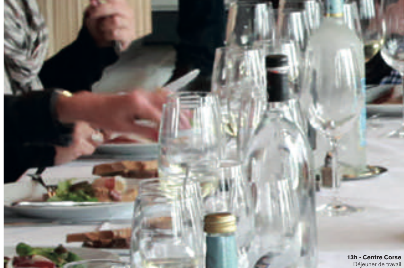
13h - Centre Corse Déjeuner de travail dans un établissement de caractère.

d'île verte en Méditerranée. Parce qu'elle est à la fois sauvage, accueillante et préservée, empreinte d'une forte identité, la Corse est un lieu unique qui génère les émotions les plus fortes créant de vraies surprises et des rencontres humaines qui marqueront le déroulement des séjours affaires. Profitez des atouts de ce territoire qui saura répondre au mieux aux exigences et ambitions des organisateurs et des participants avec de belles émotions en perspective !