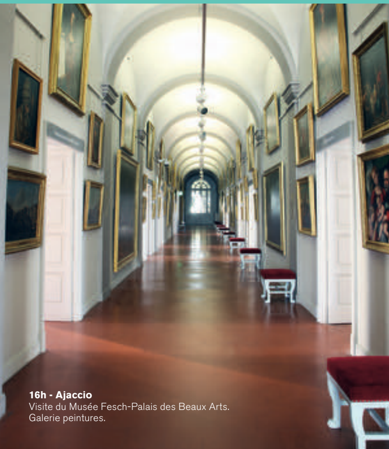
16h - Ajaccio Visite du Musée Fesch-Palais des Beaux Arts. Galerie peintures.

Apprécier un événement musical, visiter un musée, randonner sur des sentiers vous menant vers des points de vues exceptionnels, profiter du coucher de soleil autour de produits insulaires, flâner dans un village, la Corse, de par sa géographie, est sans nul doute le lieu idéal pour combiner séances de travail et détente.