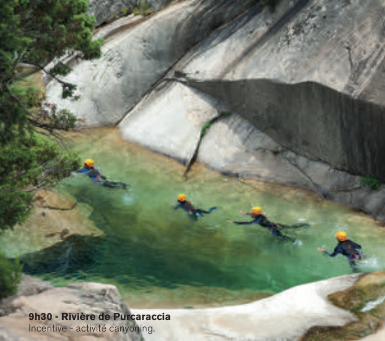
9h30 - Rivière de Purcaraccia Incentive - activité canyoning.