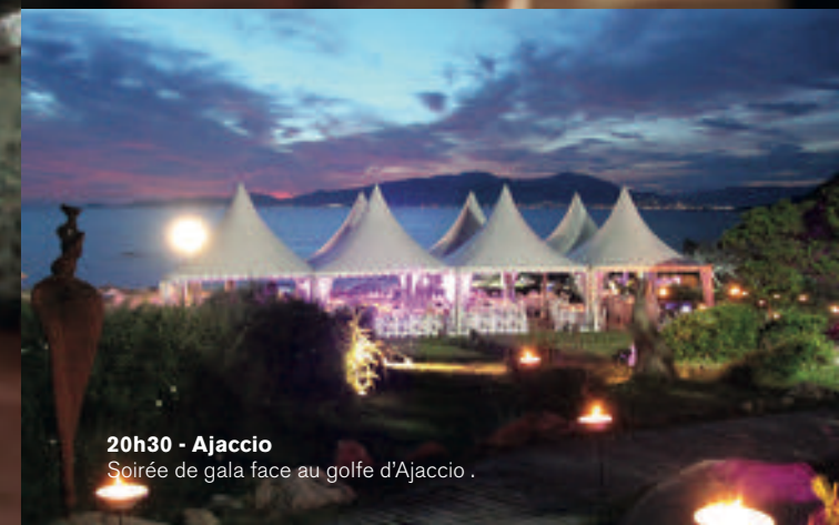
20h30 - Ajaccio Soirée de gala face au golfe d'Ajaccio.