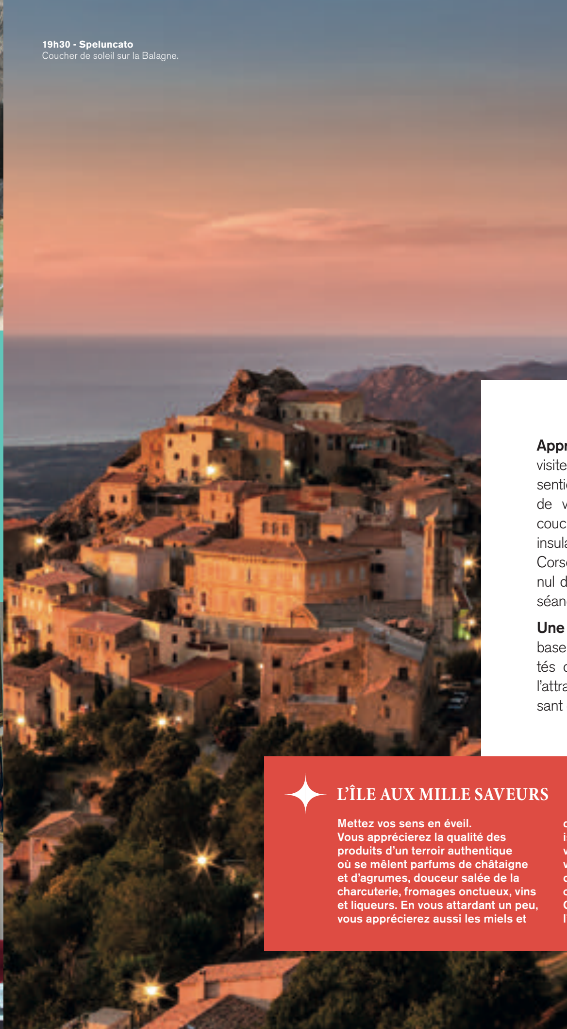
19h30 - Speluncato Coucher de soleil sur la Balagne.